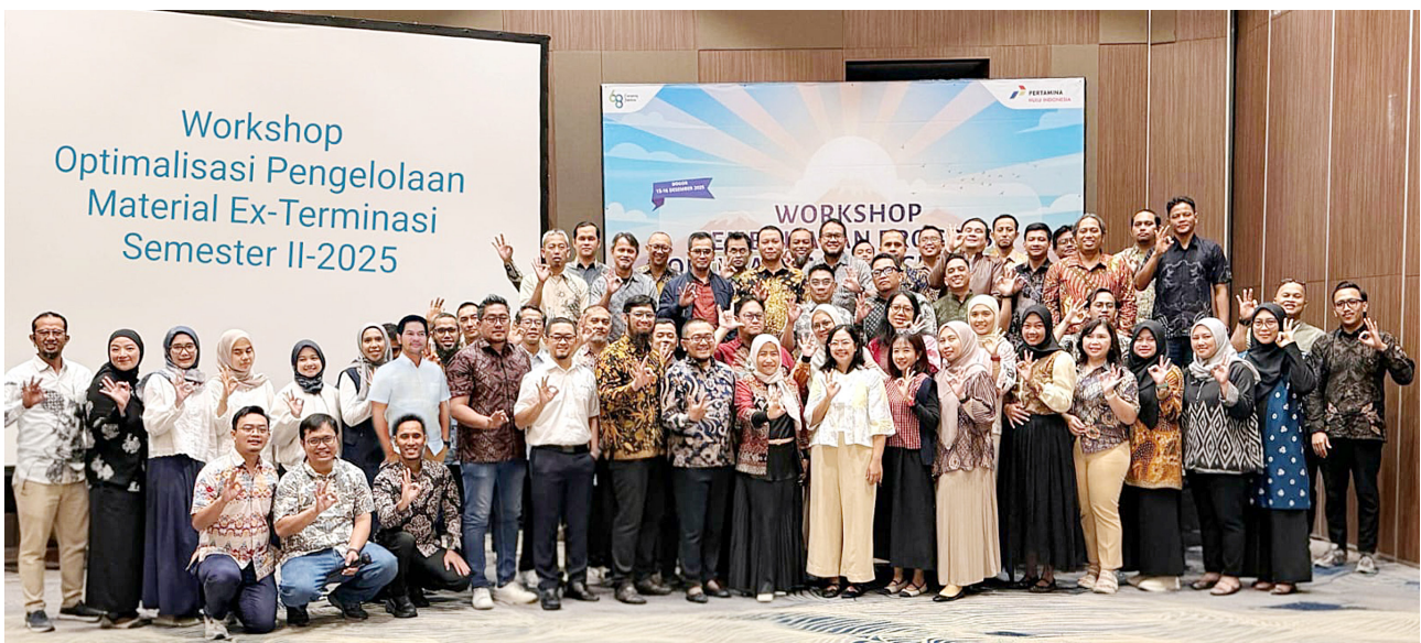
Mengejar Zero Maxter - Para wakil dari berbagai fungsi terkait di PHI hadir dalam Workshop Optimalisasi Pengelolaan Maxter Semester II-2025, 15-16 Desember 2025.

Hal ini merupakan tantangan tersendiri bagi PHI untuk mengelola aset material tersebut. Sebelumnya Optimalisasi Material Ex-Terminasi (Maxter) melalui program OPTIMUS dilakukan dengan pemanfaatan material secara langsung, namun setelah tahun 2023 pemanfaatan difokuskan pada reverse engineering .