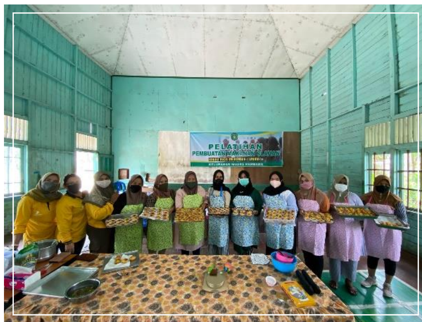
Kegiatan pelatihan pembuatan makanan olahan UKM Sinergi.